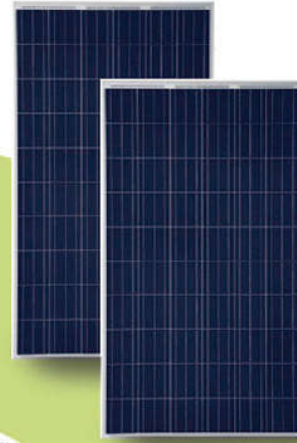
Paneles PERC HALF CELL (Opcional)